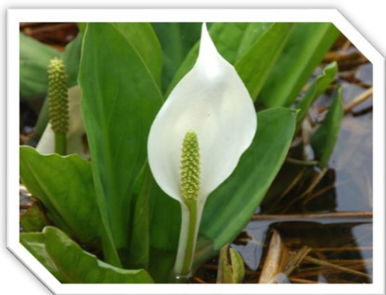
表紙の花「ミズバショウ(水芭蕉)」 花言葉は、