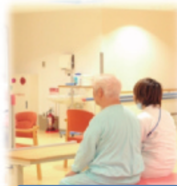
たまには休憩も・・・