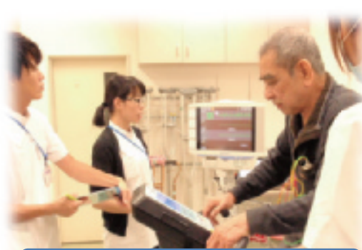
心臓リハビリテーションの様子