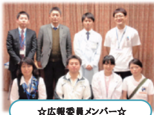
☆広報委員メンバー☆