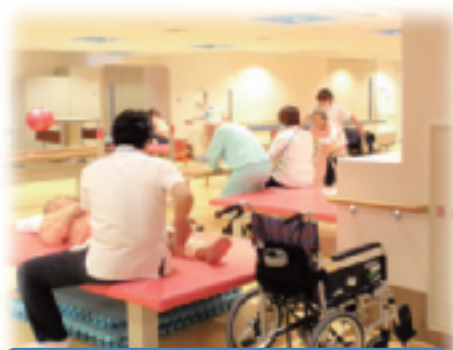
病棟内でのリハビリの様子