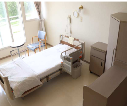
居室（個室）トイレ・洗面台付き