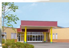
介護老人保健施設 葵の園・上越