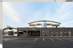
特別養護老人ホーム 葵の園・新潟内野