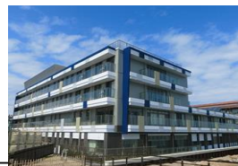
介護老人保健施設 葵の園・新潟島