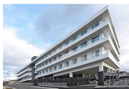
介護老人保健施設 葵の園・新潟寺尾