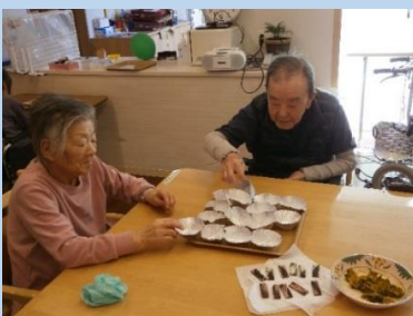
かぼちゃマフィン & じゃがいもチーズ