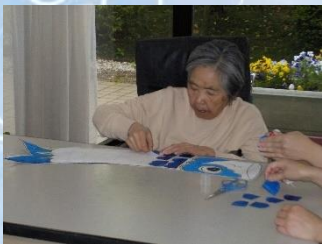
ウロコを切って、切って.. 鯉のぼりに貼って、貼って.. 完成～！