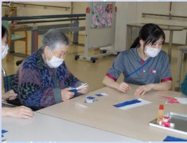
5月の制作風景です。 出来上がりはこちら→

雨が續くと、外へ出る機会も減ってきます。リハビリでは、集団リハビリの一つとして、リハビリ室のカレンダーの作成を行っています。毎月のカレンダーを季節に合わせて制作しています。6月は、この季節にふさわしい花、紫陽花がカレンダーを彩る予定です。