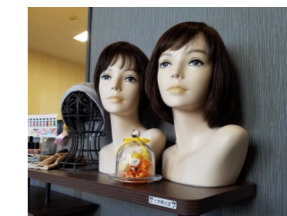
患者様のご要望に応じて、ウィッグ・帽子・ネイルを紹介しています。