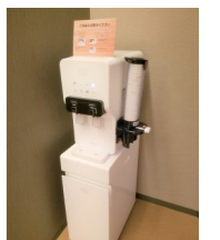
ウォーターサーバーをご利用ください。常温・冷水をご用意しております。