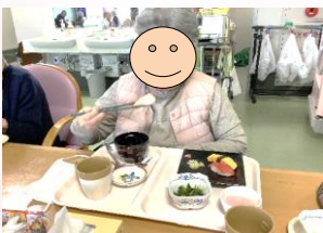
ブリはおかわりもでき、大満足です♪