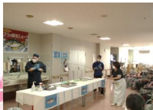
釣りにクイズと盛り上がりました♪