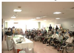
多くの方にお集まり頂きました♪