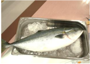
脂の乗った立派なブリです♪

その日のお昼ごはんは久しぶりの握り寿司となり皆さん、大好評で、特に脂の乗ったブリはトロツとしてとても美味しく食べ応えがありました。