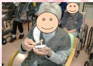
目の前で捌いたブリのお刺身をパクッ♪