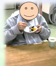
フルーツのカット、盛り付けも皆さんが担当です♪